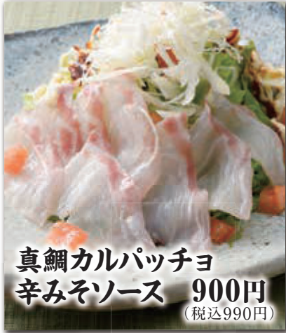
真鯛カルパッチョ 辛みそソース 900円 (税込990円)