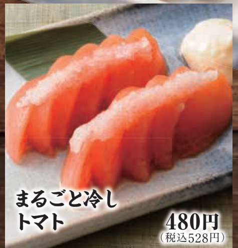
まるごと冷し トマト 480円 (税込528円)