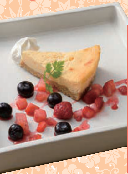
那須御養卵のチーズタルト 480円 (税込528円)