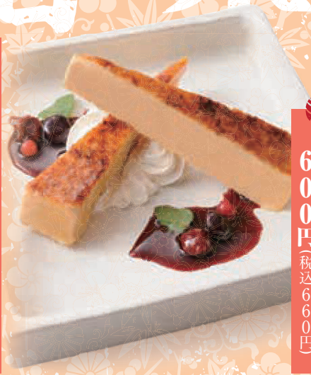
和三盆のカタラーナ 600円 (税込660円)