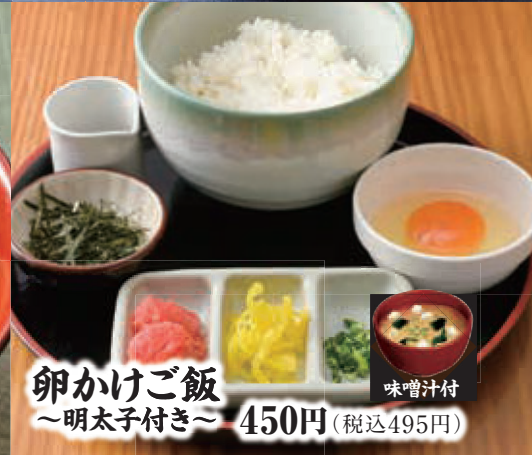
卵かけご飯 ~明太子付き~ 450円 (税込495円)