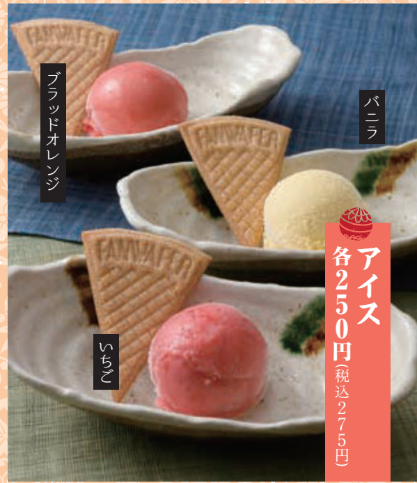
ブラッドオレンジ