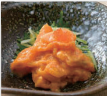
ウニサーモン和え 530円 (税込583円)