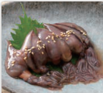
ホタルイカ沖漬け 500円 (税込550円)