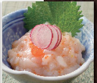
イカ明太和え 500円 (税込550円)