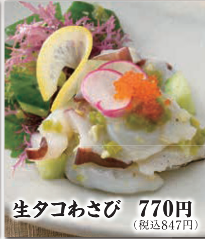
生タコわさび 770円 (税込847円)