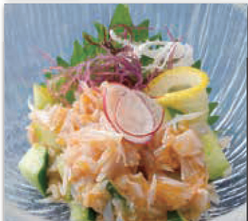
梅水晶 530円 (税込583円)