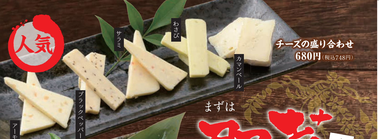
チーズの盛り合わせ 680円 (税込748円)