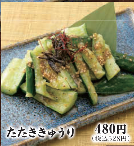
たたききゅうり 480円 (税込528円)