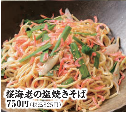
桜海老の塩焼きそば 750円 (税込825円)