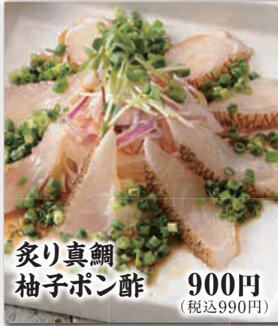
炙り真鯛 柚子ポン酢 900円 (税込990円)