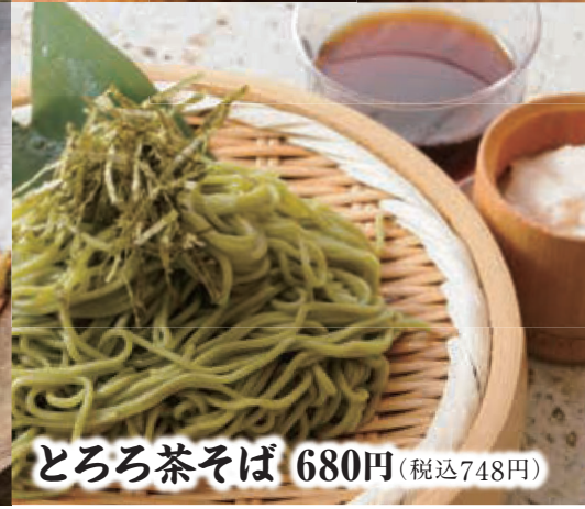
とろろ茶そば 680円 (税込748円)