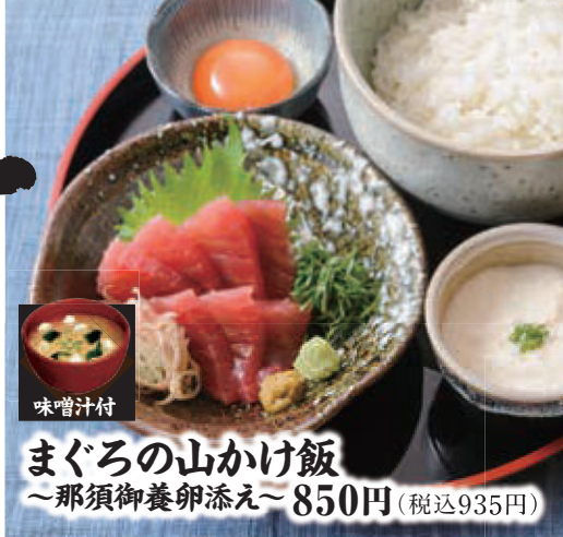
まぐろの山かけ飯 ~那須御養卵添え~ 850円 (税込935円)