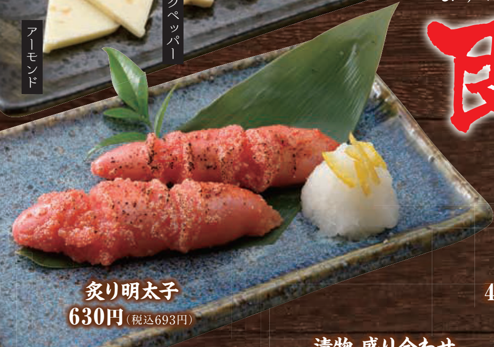
炙り明太子 630円 (税込693円)