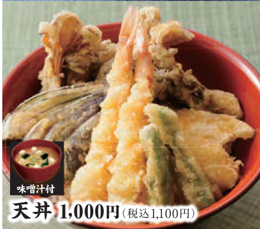
天丼 1,000円 (税込1,100円)