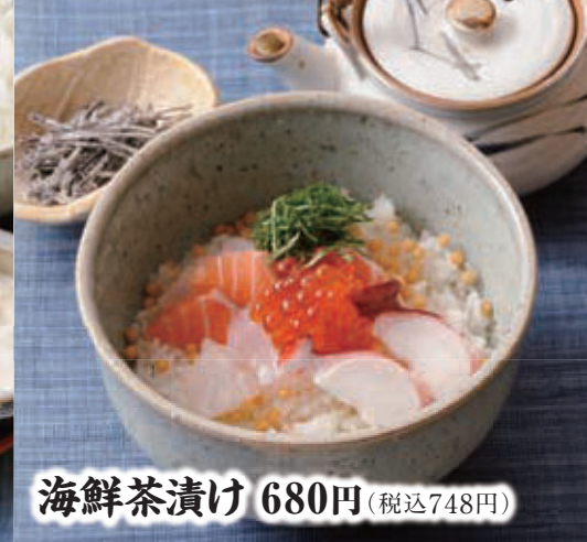
海鮮茶漬 680円 (税込748円)